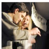
Open Mic POTRVÁ #62 6. 3. 2013 fotografie: 60

www.openmic.eu www.picasaweb.google.com/openmicnaprahu