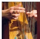
Open Mic POTRVÁ #61 6. 2. 2013 fotografie: 57