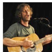
Open Mic POTRVÁ #60 2. 1. 2013 fotografie: 49